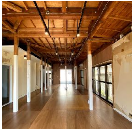
オーナー費用負担無しで再活用する、空き家戸建て借り上げ事業の第一弾「WORKING HOUSE 上池台」の外観と内観（壁：塗装前）

借り上げ事業者の資金で適切なリノベーションを行い、オーナー投資0円で借り上げる新たな活用の仕組み。住宅としてだけでなく新たな使い方をデザイン。オーナーにはその収益から一定の賃料が支払われます。